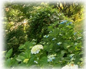
紫陽花の季節になりました。 大野でこんな綺麗な紫陽花を見つけました。